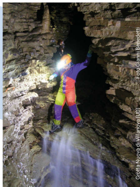
Grotta Nuova di Villanova (UD)

La Federazione Speleologica Regionale del Friuli Venezia Giulia è nata nel 1997. Organizza mostre, convegni e incontri regionali di speleologia; ha al suo attivo diverse pubblicazioni tematiche e, per più di 10 anni, ha curato l'edizione cartacea del notiziario mensile La Gazzetta dello speleologo , ora rivista on line. Ha promosso spedizioni speleologiche e ricerche scientifiche. Promuove e coordina azioni di tutela ambientale, corsi e stage e altre iniziative sempre nell'ambito della Regione. Ha sviluppato diversi progetti fra cui la promozione degli impianti a Led al posto di quelli a carburo e la posa di targhette identificative all'ingresso delle cavità naturali. Dal 2007 e per 10 anni, ha gestito, tramite convenzione con la Regione, il Catasto Regionale delle Grotte.