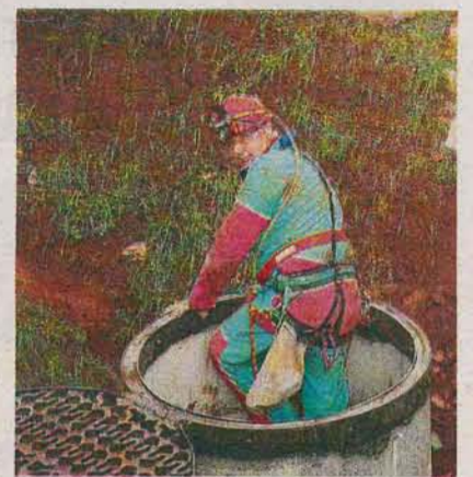
L'imboccatura della Grotta

L'entusiasmo della scoperta riporta alla mente le gesta del lodigiano Franco Anelli, che il 23 gennaio 1938, per la prima volta, si calò con 3 spezzoni di scala da muratore nelle Grotte di Castellana.