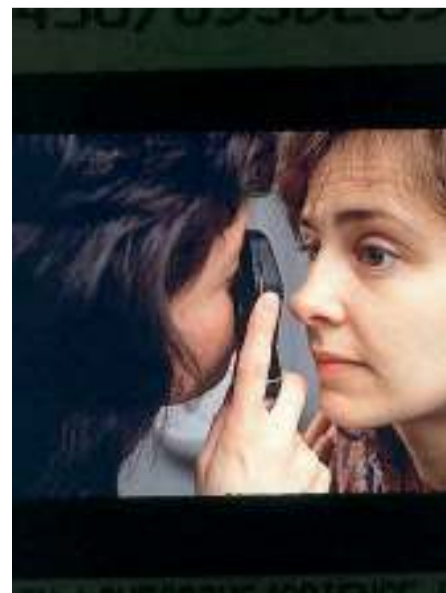
SAN NICANDRO Visite oculistiche nelle scuole

■ SAN MARCO IN LAMIS - Il comune di San Marco in Lamis ha aperto le adesioni al bando pubblico per l'assegnazione di contributi per interventi di prevenzione sismica. Possono essere presentate le istanze per l'assegnazione di contributi. [a.l.s.]