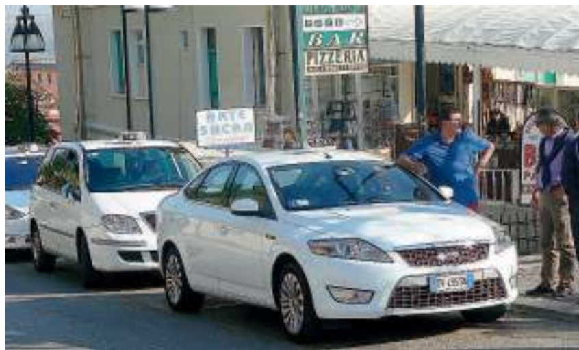
SAN GIOVANNI ROTONDO Tassisti sangiovesi chiedono la revoca di una vecchia delibera

MANFREDONIA L'ECONOMIA TURISTICA OGGETTO DI TESI