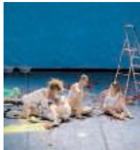
"Calore" di Enzo Cosimi