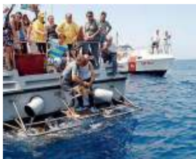
MANFREDONIA Rilascio tartarughe