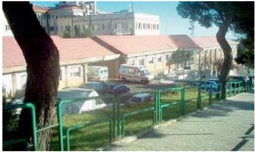
MONTE SAN ANGELO Partono nuovi servizi nell'ospedale soppresso

ISOLE TREMITI L'8 E 9 RIUNIONE REGIONI ADRIATICHE