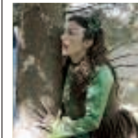
Dalle 11 il bosco di Selva Reale dà appuntamento ai bambini

Quando si parla di Halloween la fantasia corre verso mondi inesplorati. Nel Magico Bosco di Selva reale (agro di Ruvo) tutto diventa però a misura di bambino e anche l'evento più pauroso dell'anno si trasforma in un'incredibile avventura magica. Dalle 11 il bosco si trasforma in un luogo misterioso abitato da streghe, folletti dispettosi e strani personaggi che animeranno la mostruosa Festa delle streghe a cura dell'associazione ASud di Macondo. Tutti i bambini sono invitati ad arrivare mascherati e in programma ci sono l'accoglienza dei folletti con il timbro del coraggio e racconti di paura, il cerchio del coraggio, giochi a tema con musica, ricerca della strega (trampoliera) e dei dolci e cerchio finale con danze. Info 080.897.10.11. e 346.607.01.90.