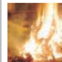
Dalle 19 il paese si illuminerà con i cento covoni accesi nelle piazze e nelle strade

La musica della Conturband, lo ska della Coquette Band, i trampolieri e i mangiafuoco di Liu.Bo e l'accensione dei falò: Orsara di Puglia è in fibrillazione per i Fucacoste e cocce priatorje (Falò e teste del purgatorio), la notte più luminosa dell'anno in cui si celebra la ricorrenza di Tutti i santi e il culto dei defunti. Il paese prenderà fuoco dalle 19: al rintocco delle campane della Chiesa madre, più di 100 covoni di legna preparati in ogni piazza e strada del paese si trasformeranno in falò. Alle 20.30 parte la carovana musicale della Conturband street parade e alle 22 tocca alla Coquette band in Largo San Michele. Dalle 15 a Palazzo Varo, "Laboratorio delle zucche" e concorso dedicato alla lavorazione della zucca più bella. Ingresso libero.