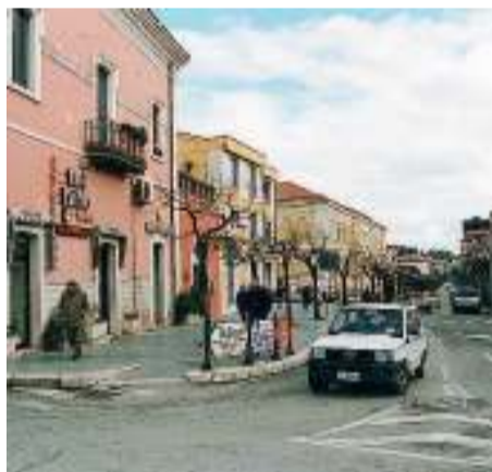
SAN GIOVANNI Una strada del centro

cosa c'entra l'amministrazione Giuliani con le primarie che riguardano l'intero centrosinistra?" è la domanda dei due. "Noi non abbiamo nulla contro il Centrosinistra" incalzano ancora "anzi ne condividiamo abbondantemente i principi. Al contrario siamo fermamente e tenacemente ostili ad alcuni dirigenti del Pd di San Giovanni Rotondo, che hanno provocato, in poco più di un anno, un esodo inarrestabile di moltissimi iscritti. Nell'elezioni comunali del 2008 il Pd ottenne 4.400 voti, mentre nell'elezioni comunali del 2011 ne prese 2000 voti. I risultati si com-