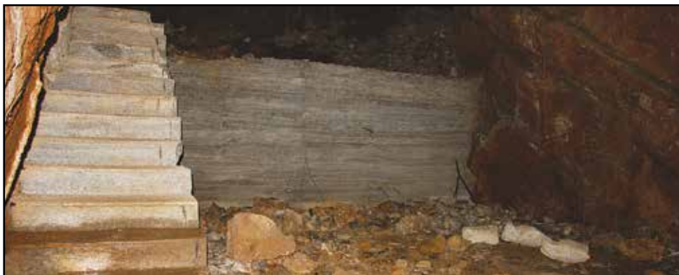
Resti di costruzioni della prima guerra mondiale nella Grotta del Monte Hermada.

Le grotte, tutte situate nella Provincia di Trieste, sono state scelte per la loro particolare morfologia e ben si prestano a una escursione in tutta sicurezza, lasciando al visitatore il piacere (e il tempo necessario) di godere della bellezza e della unicità degli ambienti.