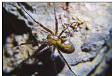
Grotta del Monte Gurca. Fauna cavernicola: cavalletta Troglophilus neglectus e ragno Meta menardi . (Sergio Dolce)