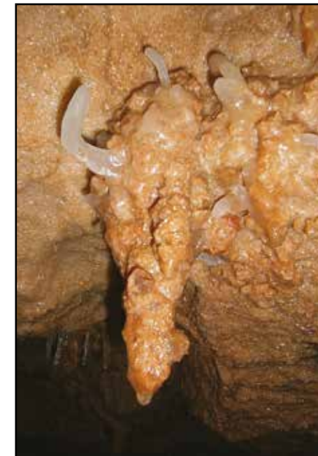
Grotta del Paranco. (Daniela Perhinek)