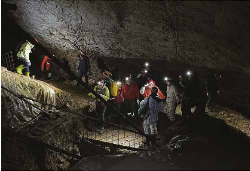
Nella Caverna Pocala di Aurisina.