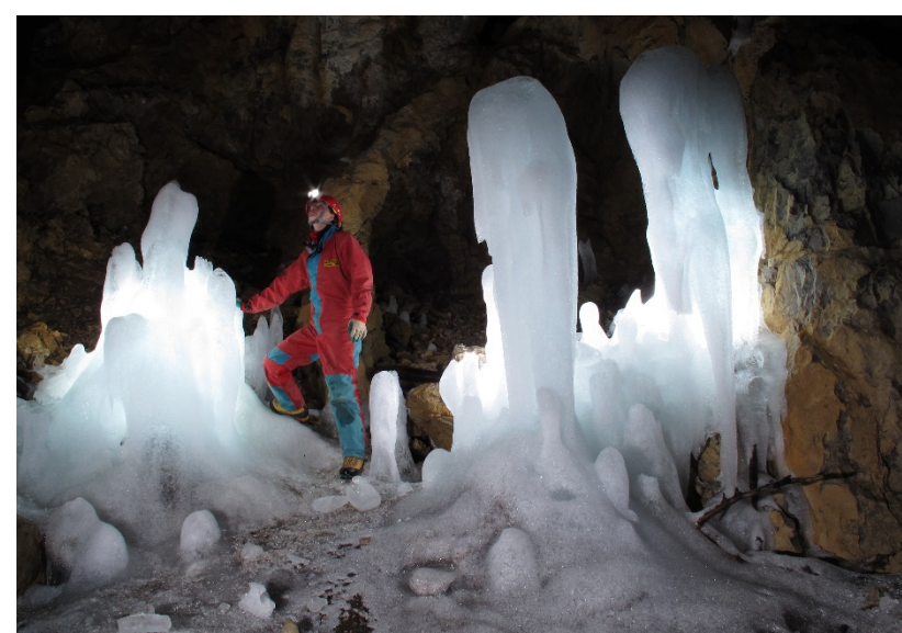
Ghiacciaia del Moncodeno (A. Ferrario)