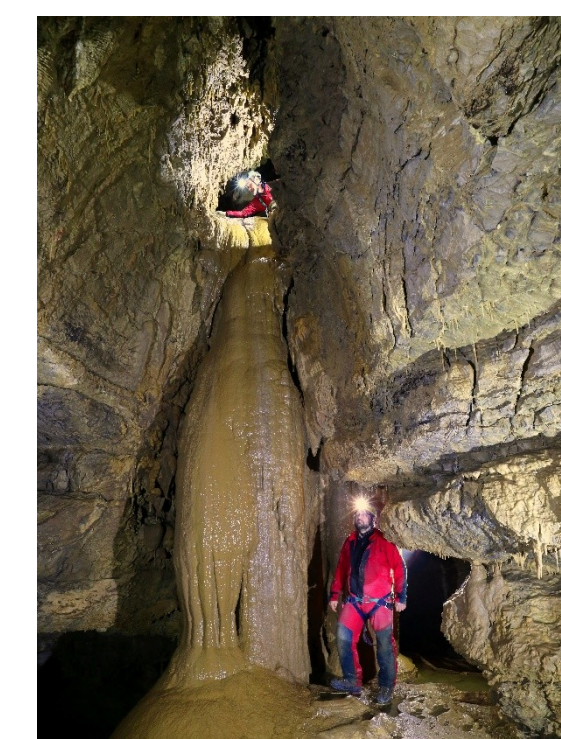
Above: Cover page of the book «Il Catasto Speleologico Lombardo» (2016).