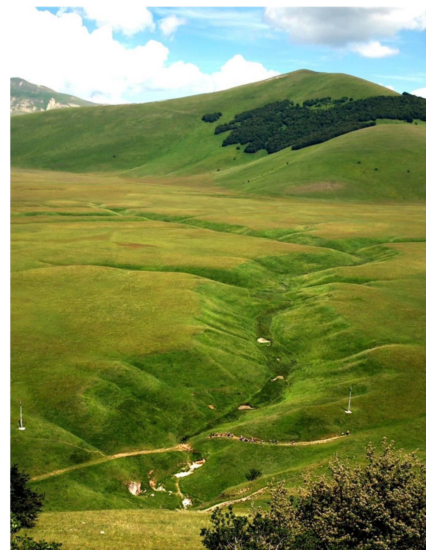
Sinkhole of the Piano Grande dei Sibillini, Umbria, Italy

In Umbria there are numerous sources of karst origin, including the Scirca spring, which collects the waters of the Grotta di Monte Cucco and feeds the aqueduct of Perugia; the springs of the Narni Gorge which together reach a flow rate of 13 m 3 / s draining the waters of the Narnese Amerina ridge and a large part of the deep hydrological system of southern Umbria