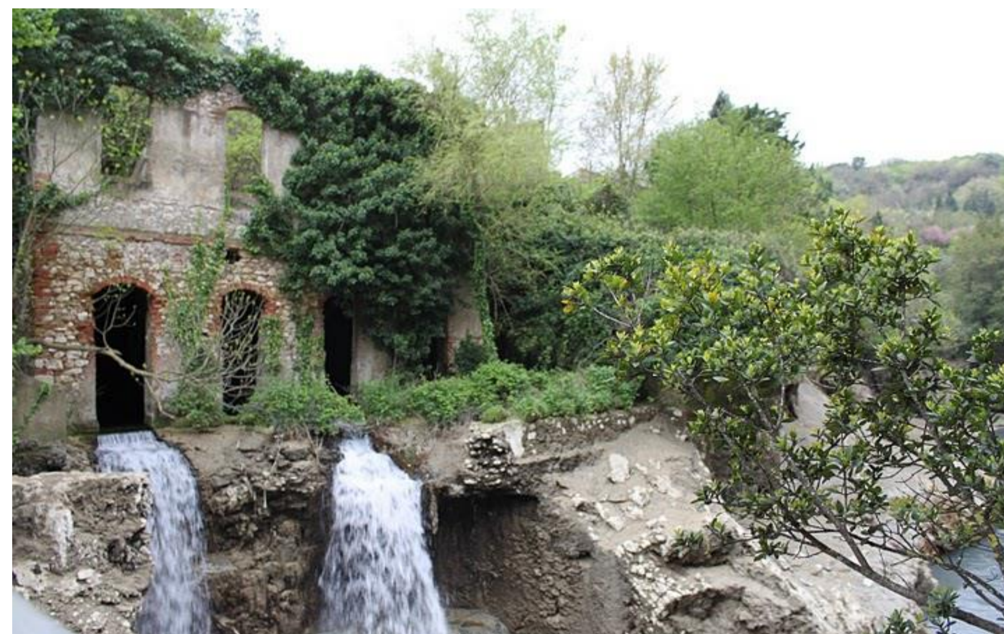
Stifone Springs – Gole del Nera – Narni